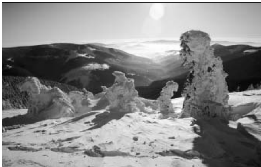
Pohled z Králického Sněžníku.