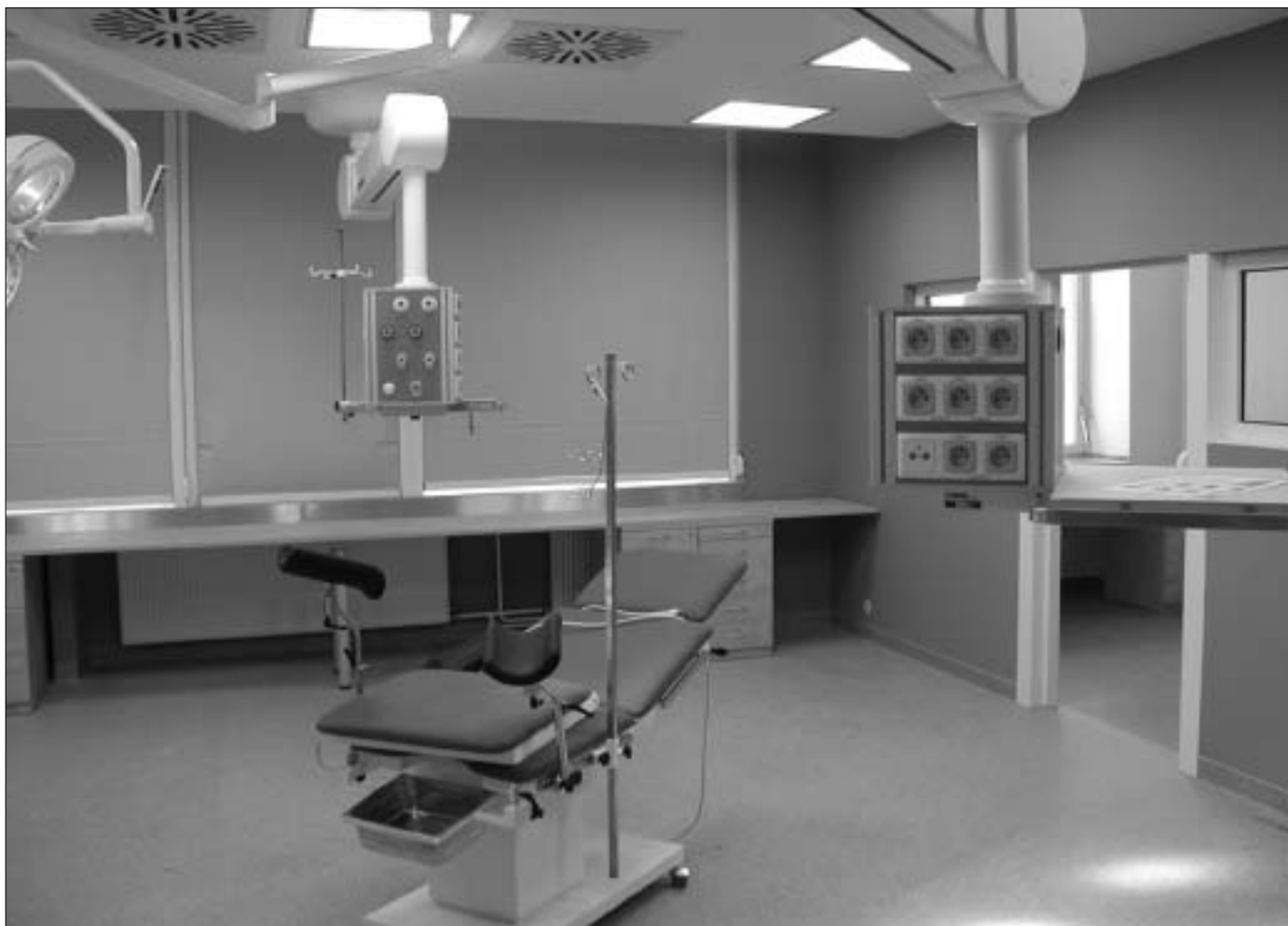
Porodnická a gynekologická klinika po rekonstrukci budovy - operační sál.

(Podle materiálu poskytnutého vedením FN HK a podle http://www.comenius.cz )