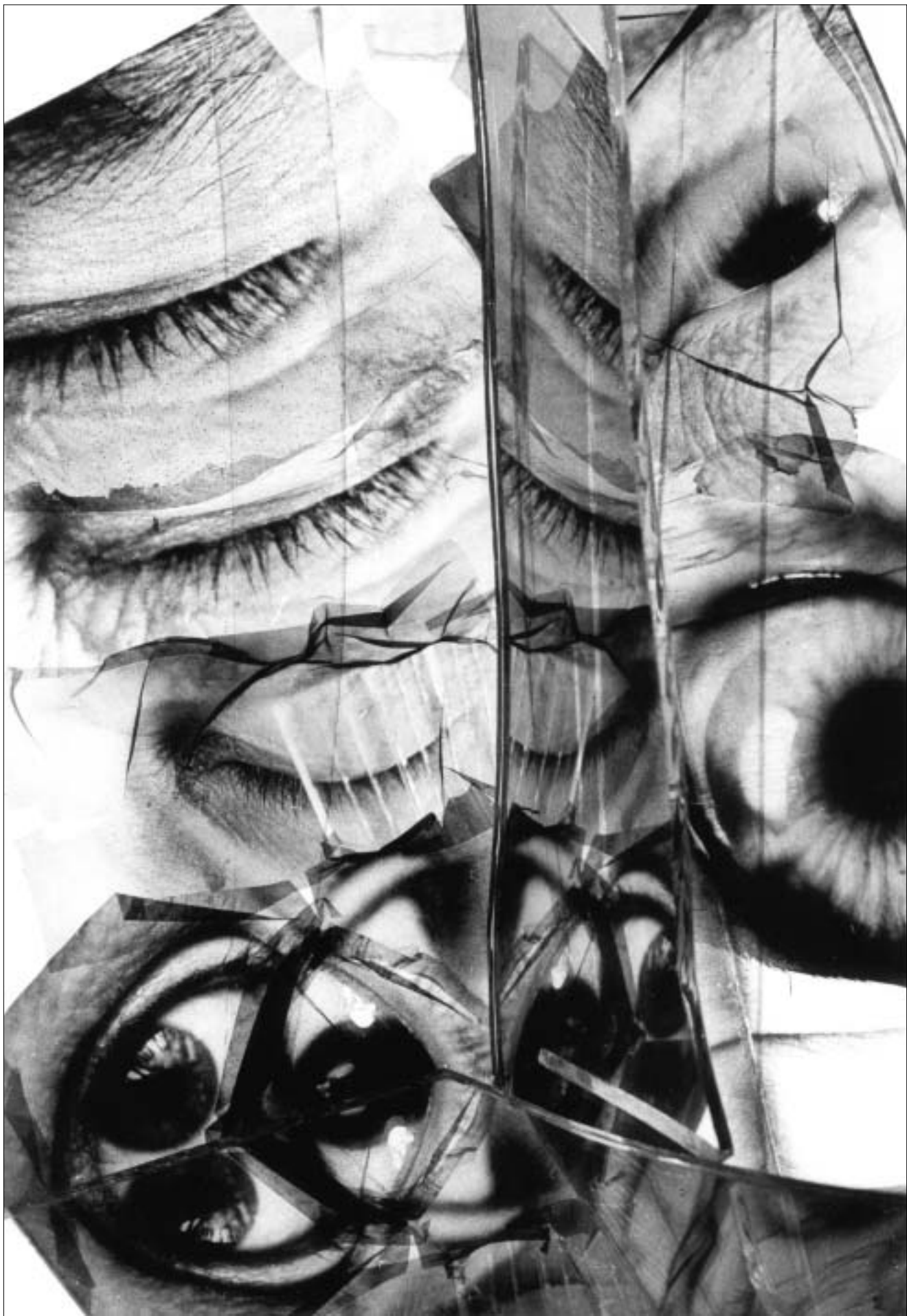
Petr Balíček / Fotografie z cyklu »Protokol o těle« (1986)