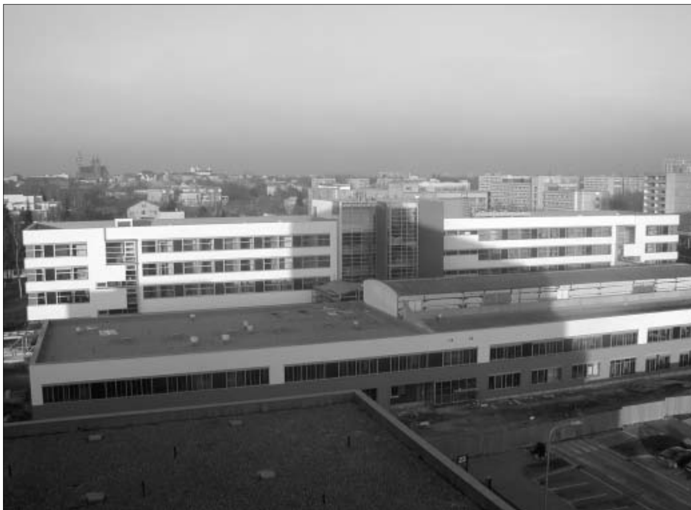
Pavilon interních oborů. Pohled z pavilonu prof. Jana Bašteckého.

Většina z nás, kteří se v areálu Fakultní nemocnice Hradec Králové každodenně pohybujeme, si leckdy už ani neuvědomuje, jak moc se zde jen za poslední roky změnilo, že mnohé z toho, co dnes běžně využíváme či kolem čeho chodíme, zde ještě před pár lety vůbec nebylo. A tak jistě stojí za to si jednou za čas připomenout, že například v roce 1993 byl předán do užívání rozsáhlý objekt kuchyně a jídelny, že v letech 1994 – 1995 byly dokončeny nové budovy Ústavu klinické biochemie a diagnostiky a Ústavu klinické mikrobiologie, v roce 1997 otevřen hematologický pavilon prof. Jana Bašteckého, v roce 2000 nová budova lékárny, v roce 2001 pavilon dialyzačního střediska, v roce 2002 zrekonstruovaný pavilon Stomatologické kliniky a nově zbudovaný objekt Tkáňové ústředny. A to jsme vyjmenovali jenom ty nejvýznamnější a rozsahem největší investiční počiny. Kromě nich se v průběhu devadesátých let a na samém počátku jedenadvacátého století ve Fakultní nemocnici uskutečnila ještě řada (často zvnějšku méně viditelných) investičních akcí – například rekonstrukce budovy Dětské kliniky, rekonstrukce operačních sálů Ortopedické kliniky, rekonstrukce ambulantního traktu Kliniky ušní, nosní a krční, sociálních zařízení v budově I. interní kliniky a Kliniky infekčních nemocí a mnohé další. Připomenout je ovšem třeba i investiční akce »zcela neviditelné«, k nimž nepochybně patří potrubní pošta, do provozu uvedená v roce 1997 a opakovaně rozšířená v letech 2000 a 2002.