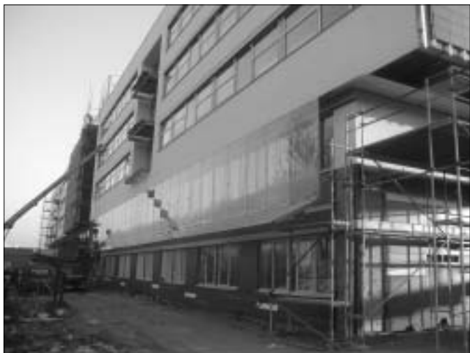
Pavilon interních oborů. Prosklená fasáda.

naznačující velikost budoucí stavby. O dva dny dříve, 28. května 2002, sice bylo slavnostně otevřeno »Hřiště snů« před budovou Dětské kliniky, a tak ve Fakultní nemocnici ubylo alespoň jedno malé staveniště. Naopak ale již 21. srpna 2002 započala královéhradecká Stavební společnost STAKO náročnou rekonstrukci budovy Porodnické a gynekologické kliniky.