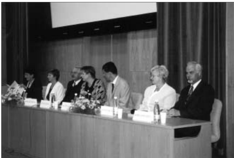
Ze slavnostního zahájení.

Ve dnech 11. – 12. září 2003 probíhal již IX. ročník mezinárodních sesterských pracovních dnů pořádaných Fakultní nemocnicí Hradec Králové ve spolupráci s královéhradeckou Lékařskou fakultou Univerzity Karlovy a Českou asociací sester. V prostorách kongresové budovy Univerzity Hradec Králové jsme se sešli, abychom diskutovali nad tématy: vzdělávání, ošetrovatelská péče v klinických oborech, bolest a ošetřování ran moderními materiály.