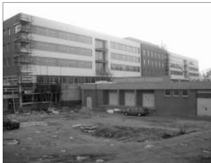
Pavilon interních oborů. Pohled od Dětské kliniky.

Jistě by bylo možné položit si i otázku, zda takto rozsáhlá investiční výstavba ve Fakultní nemocnici Hradec Králové přece