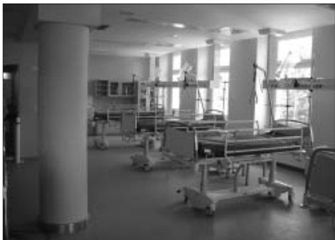
Porodnická a gynekologická klinika. Jediná intenzivní péče krátce před uvedením do provozu.