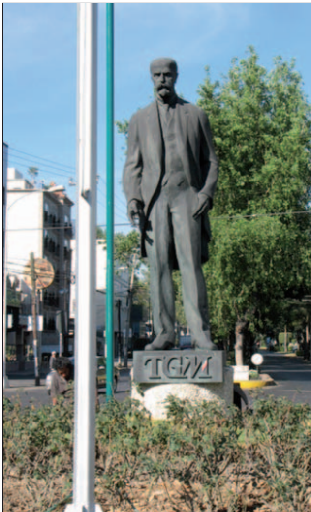
Socha TGM vévodí nejluxusnější třídě v Mexico City – Avenida Presidente Tomás Garrigue Masaryk

sirény. V této zemi je nebezpečné pohybovat se nejen mimo města, ale především v jejich okrajových částech.