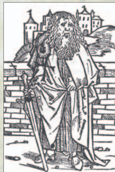
Obr. 2. Německý rytíř (křižák)

V roce 1495 se začal rozmáhat hlad, bylo málo obilí, protože v minulém roce hodně pršelo. Do toho přišel velký a náhlý mor. Takové nakažení mnozí lidé neočekávali. Ti bohatí bojíce se moru nechali sobě dělat sruby v lesích, kde bydleli, až mor pominul, což trvalo do poloviny měsíce prosince. Když hradečtí nechali po velkém ohni zhotovit nový druhý zvon, byla v nápisu poznámka, že Hradec Králové byl toho času postižen morem a povodněmi.