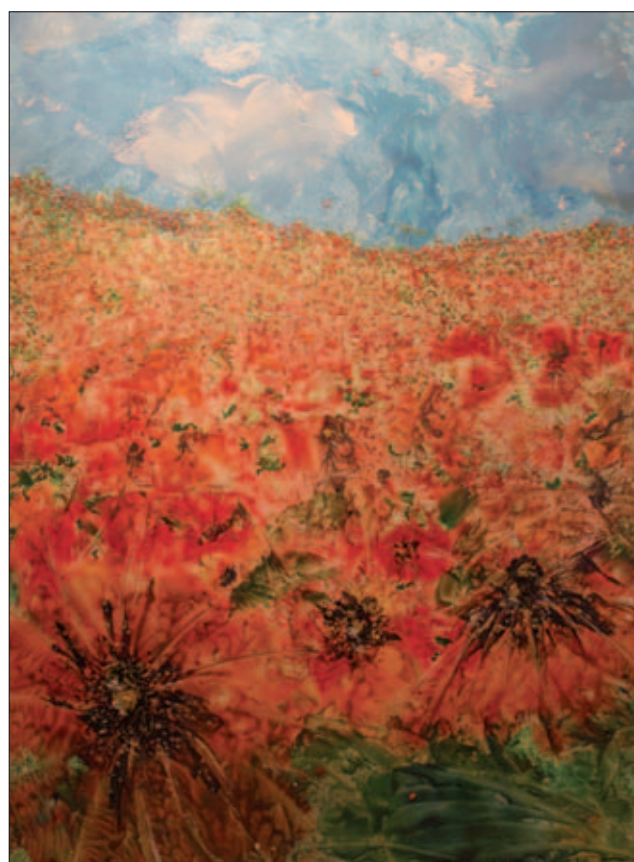
Encaustika R. Stehlíkové – Vlčí máky

Březnovou výstavu připravila Lékařská fakulta UK ve spolupráci s Centrem péče o duševní zdraví, které sídlí na Pospíšilově ulici v Hradci Králové. Centrum je určeno pro všechny duševně nemocné lidi, kteří chtějí ak-