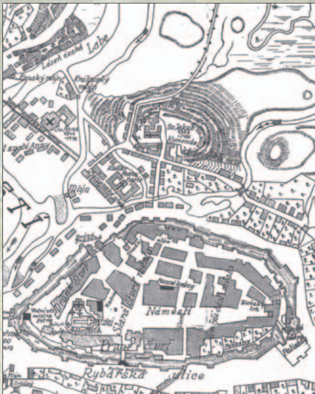
Obr. 1. Výřez z plánu města Hradce Králové, kde je vyznačena komenda Německých rytířů s kostelem, špitálem a leprosáriem. Zničeno při husitských válkách 1420; zůstal pouze kostel a špitál

Žižka těžce onemocněl a krátce na to zemřel. Mrtvý byl uložen do rakve a převezen do Hradce Králové. Doprovázeli jej kněz Ambrož a kněz Prokop; pochovali jej před oltářem u sv. Ducha. Někteří historikové uvádějí, že to bylo do sklípku (krypty), kterou si pro sebe nechala postavit královna Eliška Rejčka. Ovšem Lupacius uvádí, že tělo Žižkovo bylo pohřbeno počestně v kapli Jedenácti tisíc panen v Královém Hradci nad Labem a Orlicí a později odvezeno do Čáslavi.