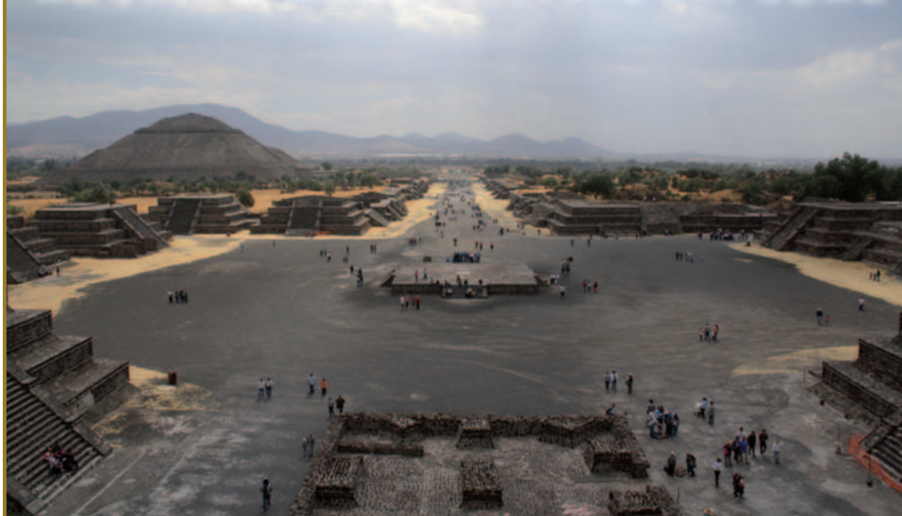
Pohled z Měsíční pyramidy na celý Teotihuacán. Poslední pohled lidí obětovaných bohům. Po levé straně je vidět větší, ale v civilizaci Aztéků méně důležitá, Sluneční pyramida