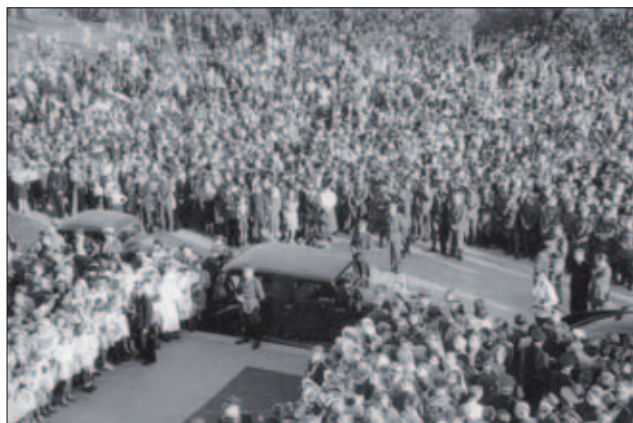
Zástupy lidí před budovou fakulty

Po projevu, který prezident přednesl před fakultou, se delegace přesunula do budovy fakulty, kde byly představeny laboratoře a posluchárny. Po prohlídce prezident vyšel ještě na balkon v 1. patře, aby pozdravil shromáždění před fakultou a slíbil, že do Hradce Králové opět brzy přijede.