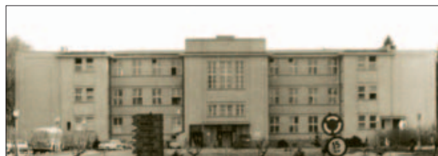
Obr. 2: Interní pavilon po nástavbě teras v r. 1949

V listopadu 1952, po vzniku Vojenské lékařské akademie,