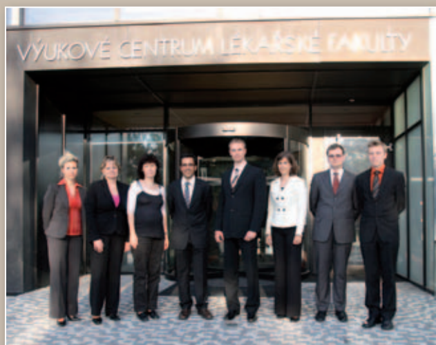
Vítězové obou sekcí