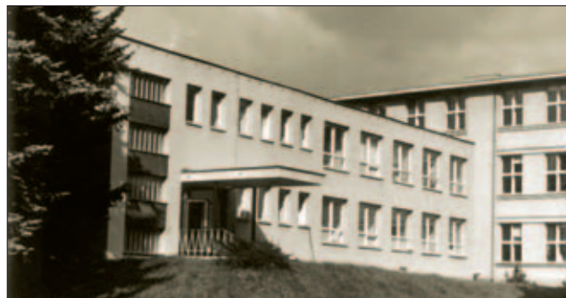
Obr. 3: Jednopatrová přístavba I. interní kliniky v r. 1967