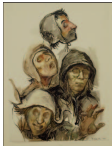
Studie podle slepců P. Bruegela