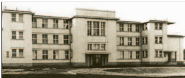
Obr. 1: Interní pavilon v r. 1928

V nové okresní nemocnici, slavnostně otevřené 4. listopadu 1928, byla budova č. 8 nazvána interní pavilon (obr. 1), i když zde bylo umístěno nejen interní oddělení. Snad žádná z budov nemocnice neprodělala tolik stavebních změn – nadstaveb, přístaveb, přestaveb a vnitřních změn jako tento pavilon. Po výstavbě nového pavilonu interních oborů v roce 2004, do kterého se přestěhovala původní 1. interní klinika, sloužila budova jako přechodné umístění pro plicní kliniku a psychiatrickou kliniku (5).