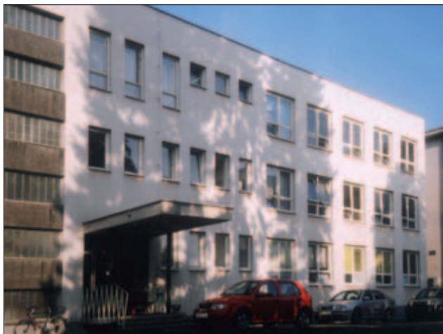
Obr. 4: Přístavba 1. interní kliniky po nástavbě 2. patra v r. 1992

zřízena posluchárna, knihovna sloužící zároveň jako výuková místnost, šatny personálu, převlékárna studentů a místnosti pro vrchní sestru a lékaře.