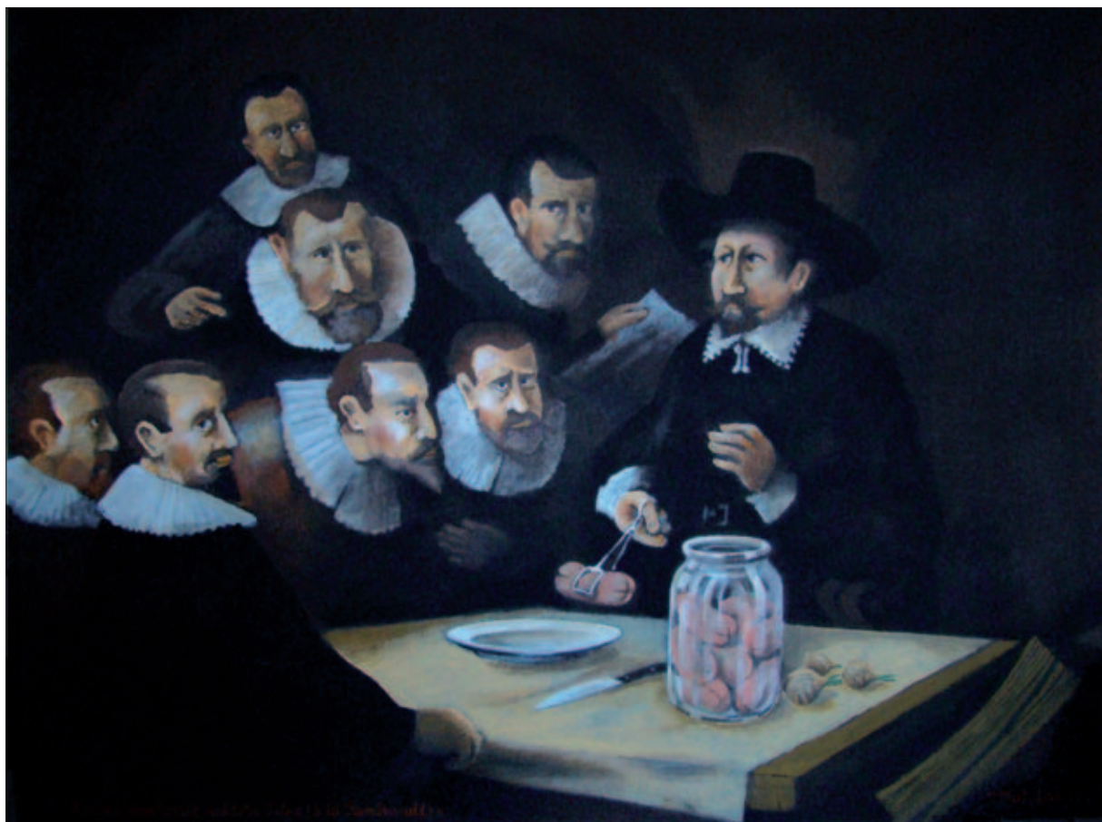
Pavel Matuška: Hodina anatomie doktora Tulpa II