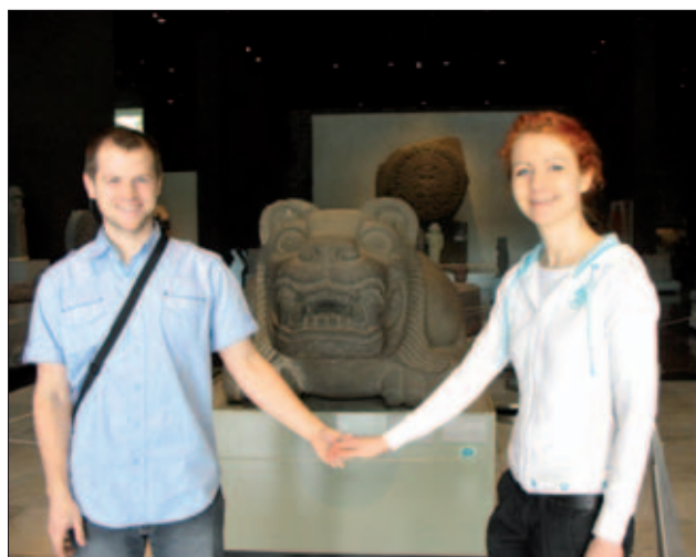
Antropologické muzeum Mexico City vystavuje nejceněnější exponáty aztécké a mayské kultury, včetně aztéckého kalendáře

Bohužel, celkový zážitek z této země kazí boj drogové mafie a vládních obranných složek, který otrásá celým Mexikem.