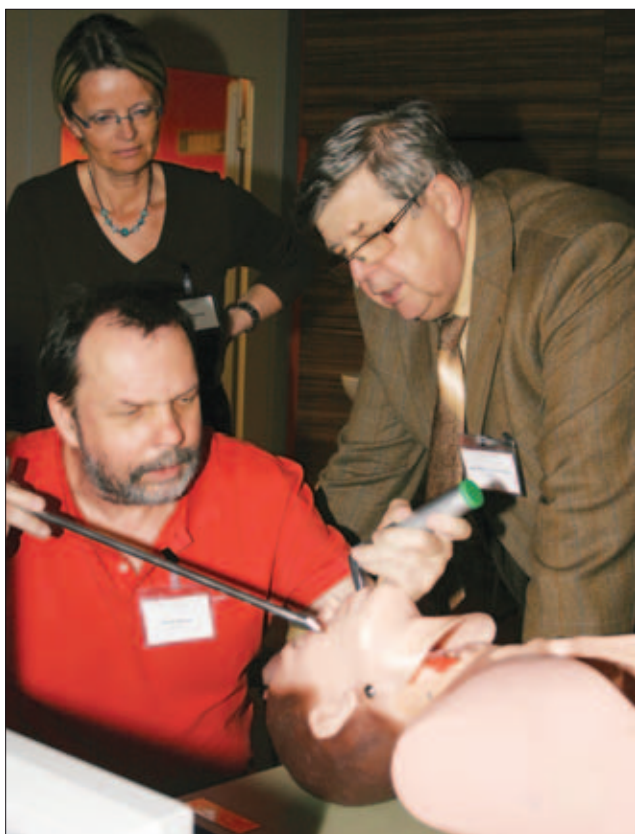
Nácvik rigidní bronchoskopie (prof. Pellant)

Ve dnech 8. a 9. dubna uspořádala Klinika otorinolaryngologie v Hradci Králové mezioborové sympozium Komplexní vyšetření horních a dolních dýchacích cest v ambulantní i klinické praxi doplněné o odborný workshop.