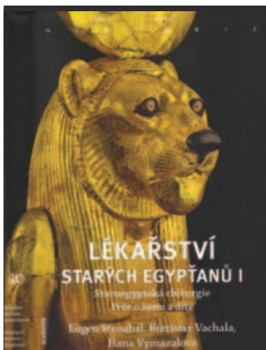
Obrázek na obálce: Soška bohyně Sachmety s hlavou lvice, patronky egyptských lékařů

Staroegyptská chirurgie; Péče o ženu a dítě Academia, 2010, 239 s.