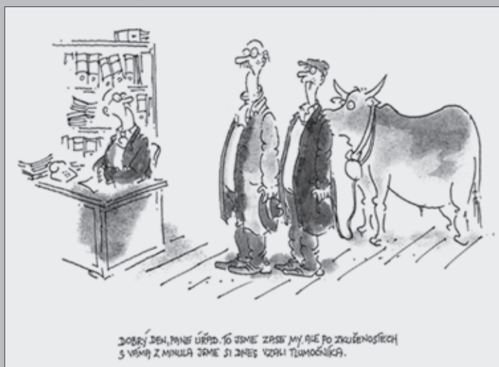
Kresba Vladimír Renčín

Na schůzích Senátu PČR vyslechl a ze stenografických záznamů zpracoval Karel Barták