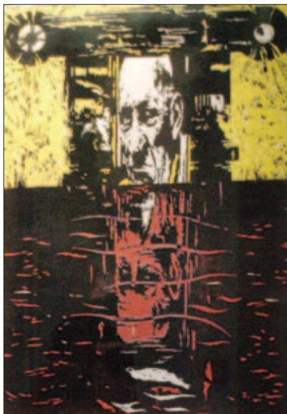
Dušan Cendelín: Brána vzpomínek (grafika)

Slavnostní vernisáž se konala 31. května; o hudební program se postaral