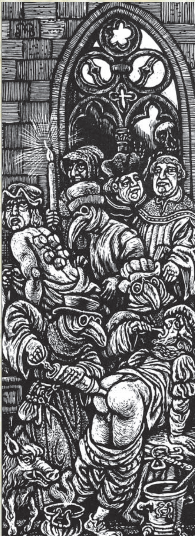
Léčba moru - tři lékaři, dva pacienti a tři bradýři se zobáky

Rada města se sešla 27. února 1586 s hejtmany i pány cechmistry a konstatovala, že žádné nebezpečnosti od moru nehrozí, a tak byl povolen jarmark, dobrý jak pro obec, tak i pro chudé řemeslníky. Město vyhořelo v červenci 1586, celkem 65 domů.