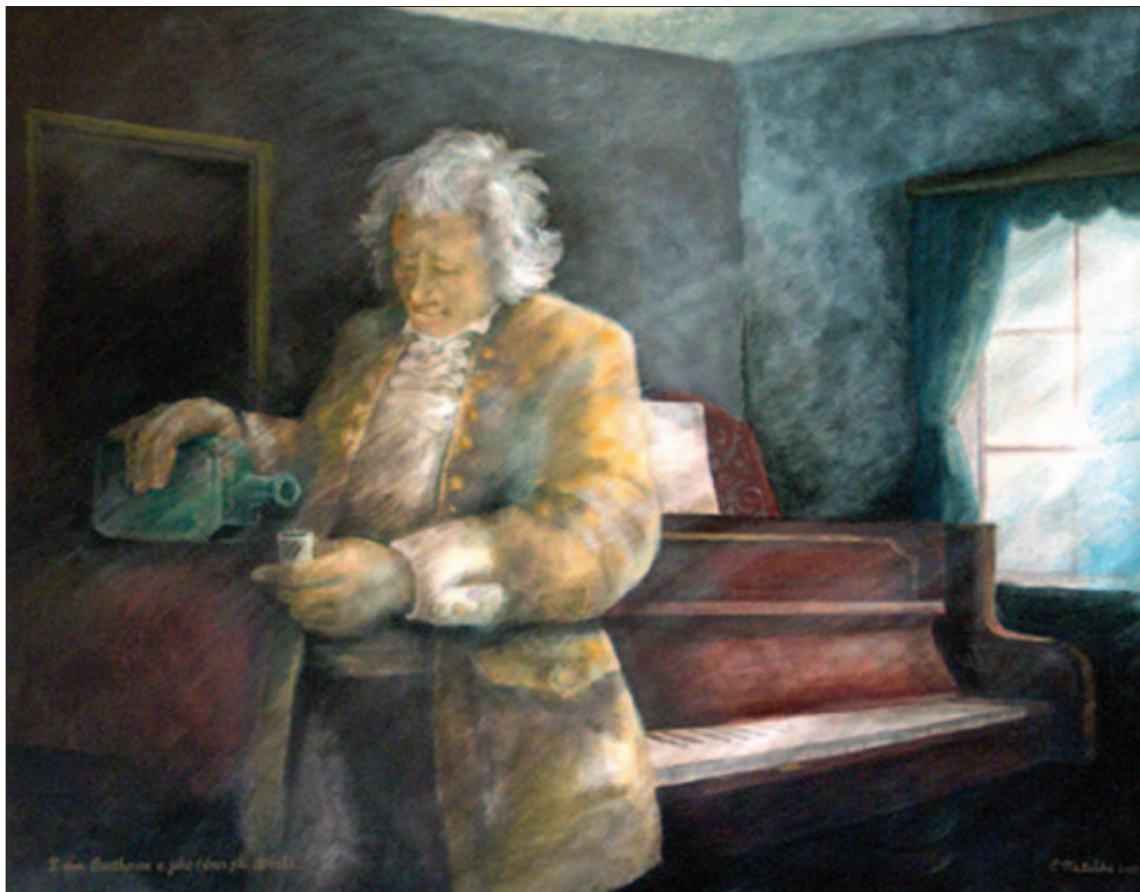
Pavel Matuška: L. van Beethoven a jeho (dnes již) devátá